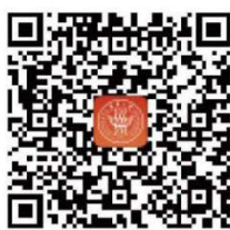
东华大学官方 移动门户APP