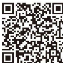
东华大学招聘 微信公众号